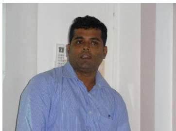
アマダーラプラ水道の