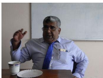
キャンディ圏水道の