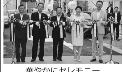
華やかにセレモニー

環境省は七月十六日、東京・渋谷区のTBSハウジング渋谷東京ホームズコレクションで新たな国民運動「COOL CHOICE(賢い選択)」のオープニングセレモニーを開催した。望月義夫環境相らが出席し、日本が世界に誇るエコ住宅、 エコ家電、エコカーなどの普及促進へ官民一体となって取り組んでいく。政府は年末にパリで開催される国連気候変動枠組条約第二十一回締約国会議(COP21)に向け