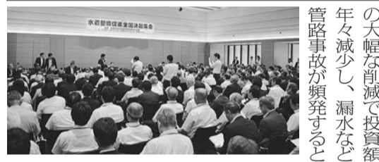
要望達成へ400名参加

昭和四十年代後半から一設は更新の時期を迎えて急速に整備された水道施設は更新の時期を迎えて急速に整備された水道施設は更新の時期を迎えて急速に整備された水道施設は更新の時期を迎えて