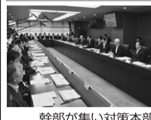
幹部が集い対策本部

国土交通省は八月二十日、中央合同庁舎三号館で第五回南海トラフ巨大地震・首都直下地震対策本部と第三回水災害に関する防災・減災対策本部を開催した。水災害分野では災害リスクを踏まえた住まい方への転換などを平成二十八年度の重点対策として決定した。