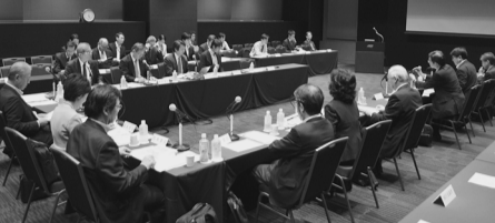
環境省懇談会が初会合

れることから、環境都市への取り組みや優秀な環境技術を世界へ発信していくことが重要だ。このため同省は昨年八月に「二〇二〇年オリンピック・パラリンピック東京大会を契機とした環境配慮の推進について」をまとめた。同懇談会でこれをさらに発展・拡大させ、さまざまな主体と連携して東京都圏における多様な環境対策を推進していく。民間事業者によるビジョンや優良事例を積極的に紹介する