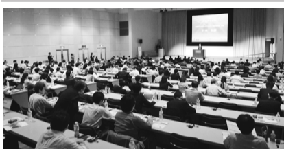
国連大学に300名集う

TO(株)や積水化学工業(株)が協力し、企業による健全な水環境・水循環への取り組み促進に向けて講演やパネルディスカッションを繰り広げた。同サミットは昨年八月一日の「水の日」に発足したウォータープロジェクトの一環として開催。健全な水循環の維持・回復をめざし、同省が提案するJAPAN Water Styleに賛同する企業や地方公共団体の取り組みを促進する。