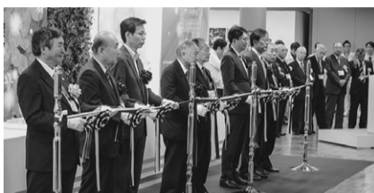
華やかにテープカット