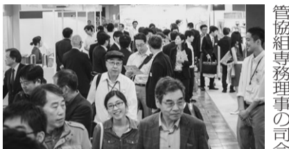
活気あふれる展示会場