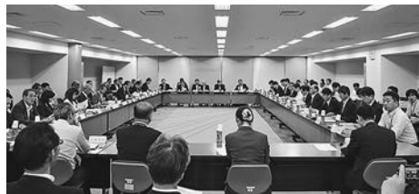
業界・企業の見える化へ素案示す

まとめに着手する。皆さまの思いをできる限り反映していきたい」と述べ、活発な議論を促した。素案では建設産業の重点課題として①担い手の確保②働き方の改善③生産性の向上④インフラの