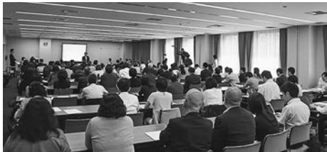
100余名が集い活発に意見交換

同省は男女共同社会の構築に向けて平成二十六年八月に「もっと女性が活躍できる建設業行動計画」を官民共同で策定。女性技術者・技能者の五年以内の倍増をめざし、トイレ・更衣室など工事