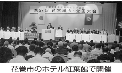
花巻市のホテル紅葉館で開催