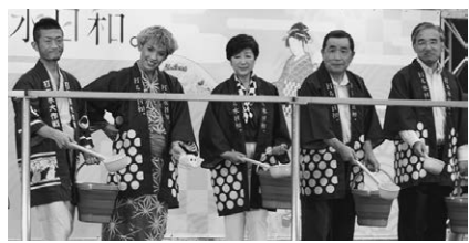
打ち水を行う小池都知事(中央)

東京都主催の打ち水大作戦2017開幕イベント「打ち水日和(びより)〜江戸の知恵・東京のおもてなし」(事務局のおもてなし)(事務局・特定非営利活動法人日本水フォーラム)が七月二十日、東京・新宿の都庁都民広場で開かれた。小池百合子都知事らが出席し、打ち水の文化・歴史・効果を学べるセミナーや打ち水グッズ作りが体験できるワークショップ