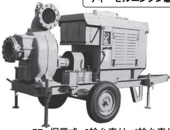
EP 据置式 2輪台車付 4輪台車付