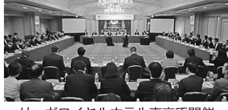
リーガロイヤルホテル東京で開催