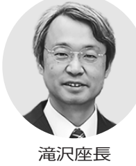
国土交通省は三月二十日、下水道分野におけるコンセッションの導入を促進するため、新たに「下水道事業における公共施設等運営事業等の実施に関するガイドライン」を改訂した。コンセ