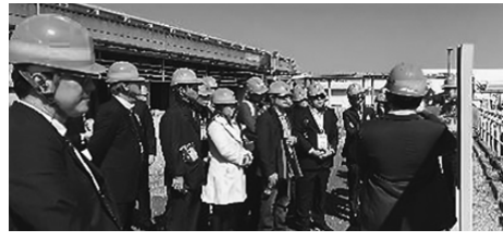
森ヶ崎水再生センターを視察

APECインフラ東京会議 国土交通省は三月十四日、東京・早稲田のリーガロイヤルホテル東京で「APEC 質の高いインフラ東京会議」を開催した。APECとASEANに加盟する二十二の国・地域のインフラ担当省庁次官・局長級幹部を迎え、質の高いインフラ投資とスマートシティの推進へ一層の協力を確認。翌十五日には日本最大の処理能力を持つ森ヶ崎水再生センターなどを視察し、高度な水処理技術や下水道事業における再生可能エネルギーの活用事例を紹介した。 高度な水処理技術など紹介 APEC(アジア太平洋経済協力会議)は環太平洋地域における多国間なフォーラム。一九八九年にオーストラリアのホ