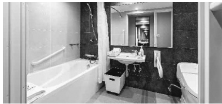
トイレ・浴室一体タイプ

同省はすべての建築物が利用者に使いやすいも設計者をはじめ利用者が、建築主、審査者、施設管理者に適切な設計情報を提供し、高齢者、障害者等の円滑な移動等に配慮した建築設計標準を作成している。とりわけ東京オリンピック・パラ