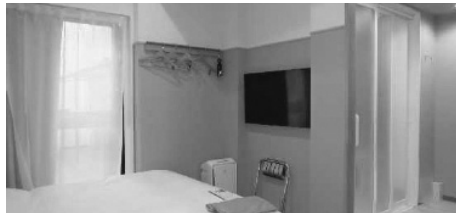
洗い場付き浴室タイプ