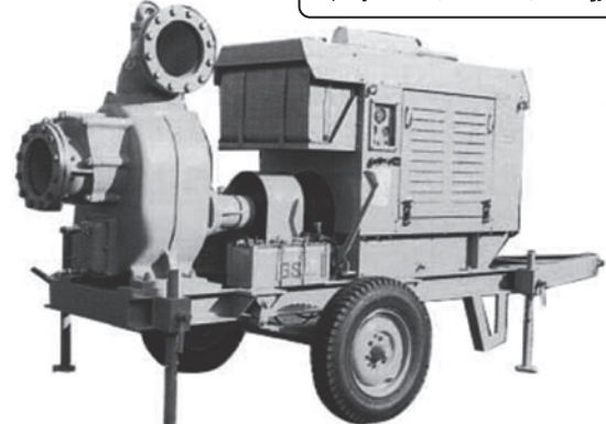
EP 据置式 2輪台車付 4輪台車付