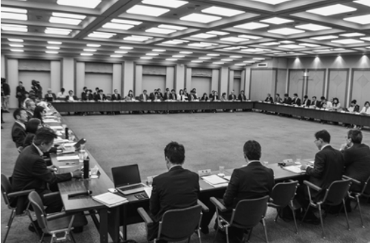
中環審部会と産構審小委が合同会合