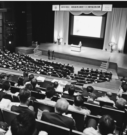
東京国際フォーラムで開催