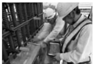
検査にタブレット活用

国土交通省は二月九日、インフラ分野のDX(デジタルトランスフォーメーション)の推進施策をまとめた。データとデジタル技術を活用し、建設業の施工管理のさらなる効率化や諸手続きの生産性向上に関するノウハウが不足しており、各社レベルでの人材育成への投資は消極的だ。また建設業退職金共済制度(建退共)における現行の証紙方式では数次の下のカードリーダーが設置できないケースも見受けられる。