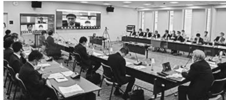
気象庁大会議室で意見交換

国土交通省は五月十七日、東京・虎ノ門の気象庁大会議室で第三回「洪水及び土砂災害の予報のあり方に関する検討会」(座長・沖大幹東京大学大学院工学系研究科教授)を開き、多様なニーズに対応する報告書骨子をまとめた。官民の役割