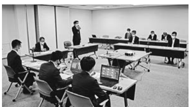
国土省検討会が初会合