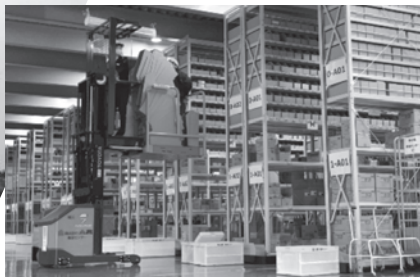
グループ拠点を結ぶ物流網