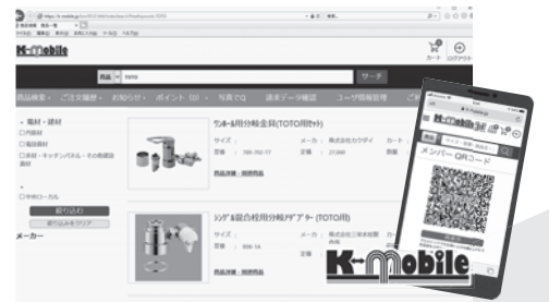
お客様向け発注管理システム「K-Mobile」