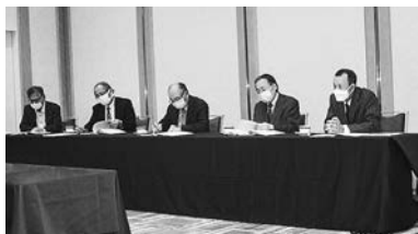
理事会後に記者会見