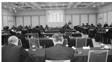
国交省を迎えて講演会

当所属企業数に応じた割当の併用方式にする。具体的には六十五名程度を目安に現在の理事数が大幅に減少する支部には