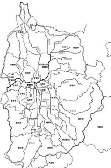
大和川水系大和川などの流域図

指定を全国に拡大し、治水安全度のさらなる向上を図っていく。その第一弾として一級河川の大和川水系大和川ほか十八河川の全国初の指定に向けて奈良県、県内の二十五市町村、流域の下水道管理者から意見を聴取し、実効性のある体制整備に着手する。下水道管理者、河川管理者、都道府県、市町村などで組織する流域総合治水対策協議会で流域水害対策計画を策定し、遊水地・輪中堤・排水機場などのハード整備、水害リスクを踏まえた土地利用規制・住まい方の工夫、雨水浸透阻害行為への許可制とする。これに伴い雨水浸透阻害行為についても宅地以外の土地で流出雨水を増加させるおそれのある行為を許可制とし、雨水貯留浸透施設の整備を義務づける。雨水貯留浸透施設の整備にあたっては民間事業者などの雨水貯留浸透施設整備計画を認定し、固定資産税の減税などの税制上の優遇措置や補助率二分の一の国庫補助、地方公共団体による管理協定制度などで支援する。