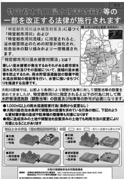
大和川流域総合治水対策協議会のリーフレット

気候変動の影響によるため、流域全体を網羅する流域治水の実現に向け、十日に公布され、十一月に基づいて特定都市河川の一日から全面施行された。国土省は流域治水関連法の中核となる特定都市河川浸水被害対策法に雨水貯留浸透施設(調整池等)の設置及び知事等の許可が必要になります。