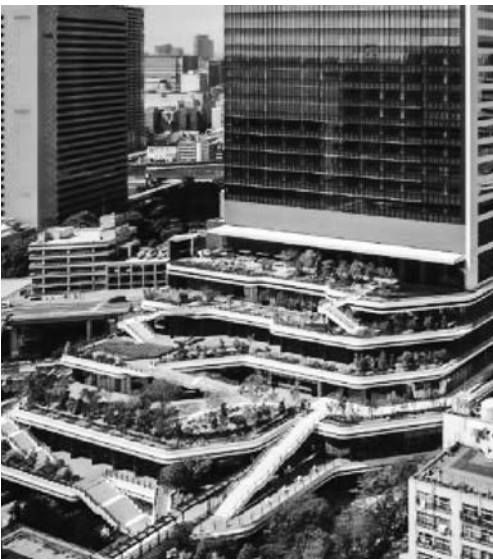
都立産業貿易センター浜松町館

となる。二階会場では恒例の福引抽選会に加え、特設イベントなどを繰り広げる。 出品内容はパイプ、継手、バルブ、コック、給排水器具、ポンプ、衛生陶器、配管材料、空調・冷暖房機器、給湯機器、浴槽、洗面化粧台、厨房設備、ソーラーシステム、貯・受水槽、汚水処理装置、消火設備、換気装置、浄化槽、配管用機械・工具、計測器、パイプ洗浄器、給排水用図面、OA機器、工用副資材、介護関連機器など。小間数は380小間程度を予定している。 前回は全面的にリニューアルされた東京都立産業貿易センター浜松町館で初めての開催