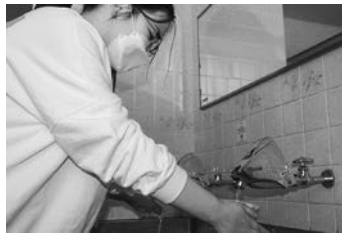
手を洗う6年生の女子と感謝の吹奏楽パフォーマンス