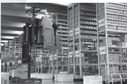
グループ拠点を結ぶ物流網