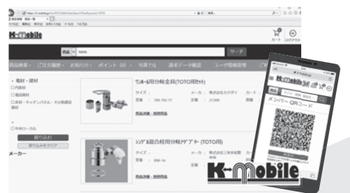
お客様向け発注管理システム「K-Mobile」