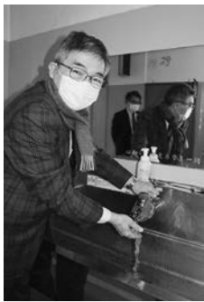
滝野川第三小学校に自動水栓を寄贈。教育現場への多大な貢献に対する。