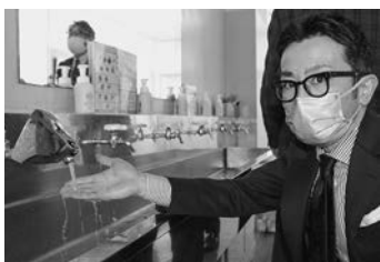
宮崎理事長(右)と南澤専務が協力して設置