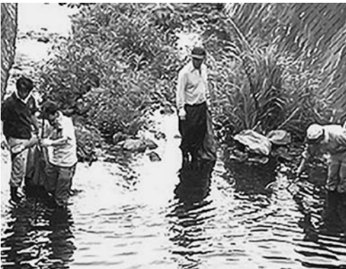
河川環境保護活動も展開

方創生推進事務局、国交省、海上保安庁、環境省、農林水産省、林野庁、水産庁、周辺自治体