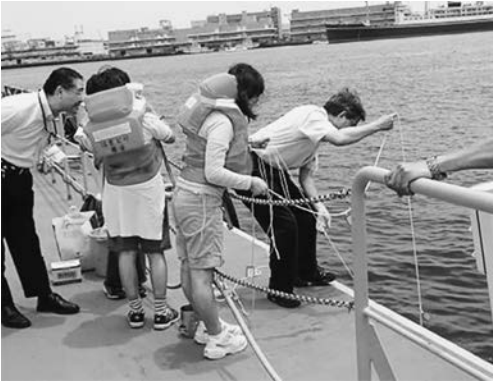
東京湾環境一斉調査を毎年実施