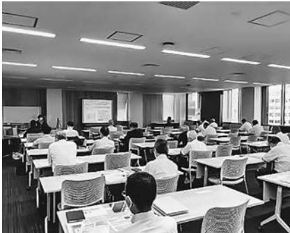
海外進出戦略セミナー

国土交通省は6月20日、国の重要な成長戦略であるインフラシステム海外展開を加速するため、新たに「国土交通省インフラシステム海外展開行動計画2022」を策定した。国土交通分野で今後注視すべき主要プロジェクトを盛り込み、重点分野に「住宅開発」を明記した。 6月3日に政府全体の海外進出戦略である「インフラシステム海外展開のある企業の案件形成・戦略2025」追補が打ち出された。これを踏まえ、国土省はトップセールスの本格的再開、O&Mの参画推進など継続的関与の強化、技術と意欲