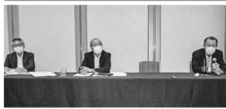
臨時総会・理事会後に記者会見

現在15名以内の副会長は10名以内に見直す。ブロック担当副会長制は廃止し、新たにブロック長制を導入する。