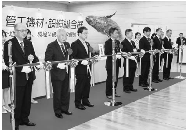
開会式で華やかにテープカット