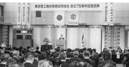
約330名が一堂に集う

14日をもって晴れの創立75周年を迎えた。記念式典は万全の新型コロナウイルス感染症防止対策を施して開かれた。冒頭、向山理事長があい