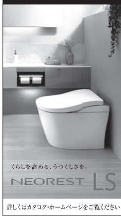
詳しくはカタログホームページをご覧ください

また、環境省の不変の原点である公害健康被害の救済・補償、子どもの健康と環境に関する全国調査、熱中症対策のさらなる強化に向けた制度改正、PFAS(有機フッ素化合物)対策など、人の命と環境を守る取り組み