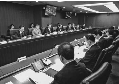
推進本部で活発な意見交換

「GX実現に向けた基本方針」を今年2月に閣議「成長型経済構造への円滑な移行の推進に関する法律案」(GX推進法)を国会に提出し、速やかな成立をめざしている。こうした状況を背景に国交省は国交相を本部長とする