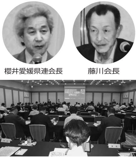
品川プリンスホテルで理事会

第63回通常総会・令和5年度全国大会は7月31日、愛媛県松山市の愛媛県民文化会館で開催。