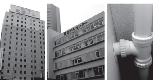
全国のホテル・病院・マンション等新築・改修工事に約1,000現場採用