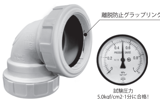
離脱防止グラブリング