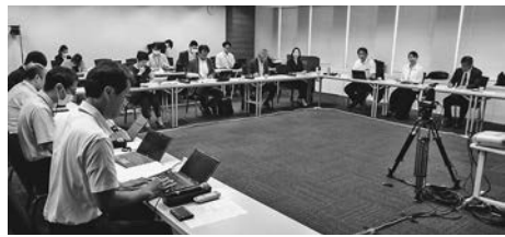
CE推進へ具体策示す