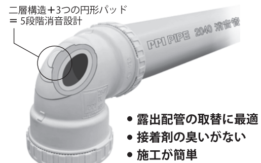
二層構造+3つの円形パッド = 5段階消音設計