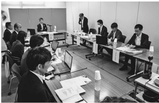
有識者会議で活発に意見交換

化する気候変動への取り組みは流域全体で考える必要がある。使えるものは何でも活用し、幅広く最先端技術を導入していくべきだ。治水・利水・水循環などを一体化した最適な水マネジメントを追求していく」と意欲を示した。