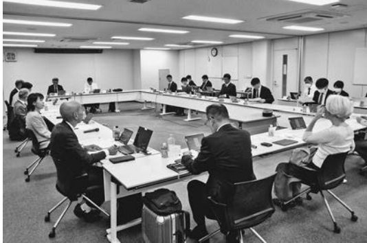
国土省検討会が初会合で活発に意見交換

議論が行われていなかった。来年4月から下水道行政が当省に移管されるタイミングに併せて外側から下水道を見直し、流域全体を俯瞰することが重要だ。水質管理など