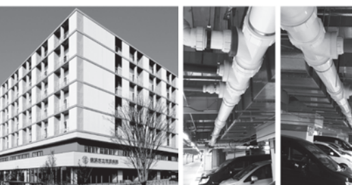
横浜市民病院内地下駐車場の天井配管(100A~300A)