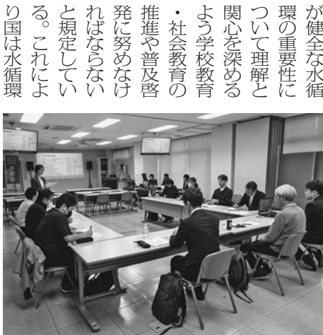
参加者による意見交換会開催

初のスキルアップ講座 にはオンライン併用で約 60名が参加。教員のほか 自治体や研究機関の職員 なども多かった。 冒頭、中込事務局長 があいさつに立ち「水循