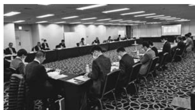
ヒアリング結果などを確認

対策、国土交通省から災 害に強い市街地形成や流 域治水対策、農林水産省 から防災重点農業用ため 池の防滅災対策などを聴 取した。水道施設では非 常用自家発電設備による 停電対策、防止壁による