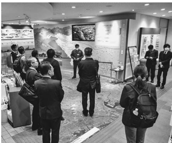
荒川知水資料館amoaを見学

内閣官房水循環政策本部事務局は11月28日、東京・北区の国土交通省荒川下流河川事務所第 1回「水循環教育スキルアップ講座」を開催した。水循環教育に関心があるものの、十分な知識 や情報が不足していることから授業に踏み切れない小学校教員などを対象に新たに実施。水循環 動画「水のおはなし」の学識者による解説や教育現場における先進的な活用事例の紹介、参加者 による意見交換会・施設見学会などを通じて水循環教育に関する認識を深めた。