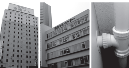
全国のホテル・病院・マンション等新築・改修工事に約1,000現場採用