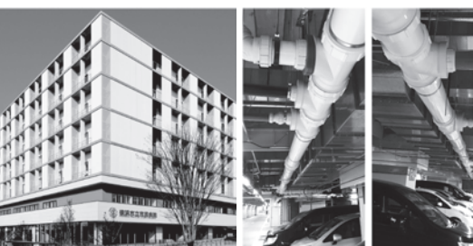
横浜市民病院内地下駐車場の天井配管(100A~300A)