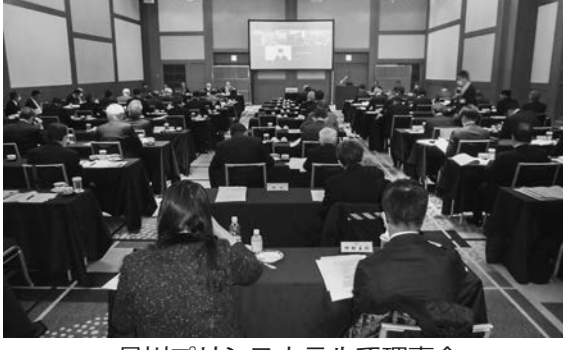
品川プリンスホテルで理事会

頃、石・富山・新潟の3県を中川県能登半島に家屋倒壊、津波、土砂崩れなどによる断水が発生し、下水処理場・ポンプ場などの機能が停止した。関係省庁・自治体は職員を派遣して被害状況の調査や応急給水、簡易トイレの搬送などに努める。全管連など関係業界団体に応急復旧への協力を要請した。当日の理事会では藤川