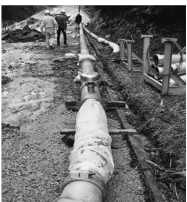
仮設管で応急復旧

水協、愛知県、大府市、名古屋など40を超える水道事業者や関係団体が給水車を派遣し