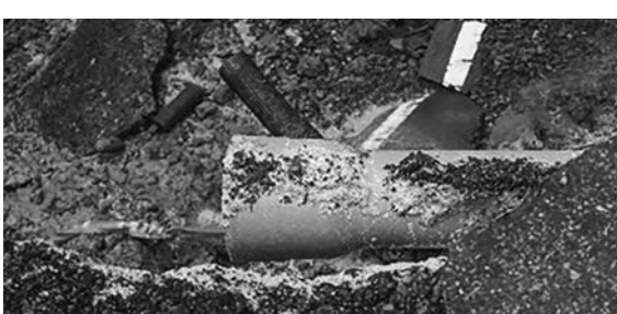
道路崩落で破損した管路