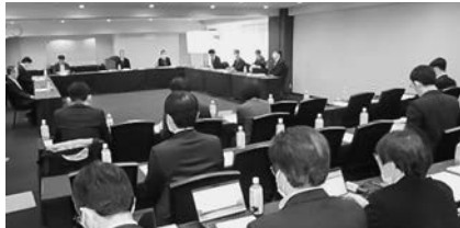
検討委分科会を開催

効率性・実効性を高めるために設置。令和4年度末にすべての都道府県で汚水処理施設広域化・共同化計画の策定が完了したことから、計画達成に向けた具体的なマニュアルの検討を進めていた。