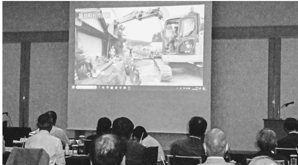
動画「水道復旧活動の記録」上映