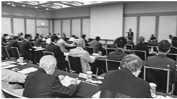
品川プリンスホテルで理事会