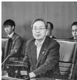
幹部職員に訓示する本部長の斉藤国交相

プロジェクトによると、防災・減災プロジェクトは、応急対応では迅速な情報収集や資機材・装備品の充実などによる自治体支援、物資輸送の確保などに力を入れる。また事前対策では上下水道など防災インフラの充実・強化