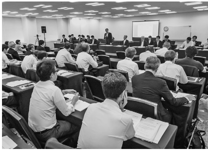
今後の重点課題を打ち出す

当日は国土交通省の塩見局長が冒頭あいさつに立ち、当協議会が「将来を担う人材を確保する」ことを目的として、建設業の改革を行なう必要がある。建設業の未来は、賃上げや働き方改革が少しずつ進んでいるが、ほかの産業に比べれば改善の余地はまだ大きい。本日は当協議会の