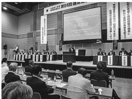
くにびきメッセに全国から約700名参集