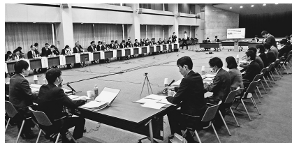
有識者・関係団体が参集

し、その実施を勧告することができ、学識者や関係団体などをつくる同ワーキンググループ(WG)では職種横断的な論点の整理に加え、WGで合意された方針が実際の取引で運用可能な職種別