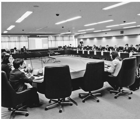
初会合で活発に意見交換

社整備は学識者や弁護士、設計会社などで構成する同小委を新設し、マンシヨン政策のさらなる